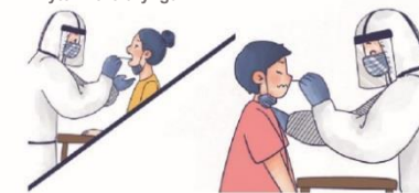
● Výtěr z orofaryngu